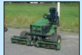
John Deere Cylinderklippare 180 cm.