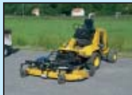
Howard 727 4WD 180 cm klippdäck.