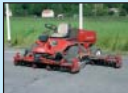
Toro Cylinderklippare 350 cm.