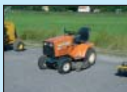
Kubota G3 HST Diesel, Klippdäck.