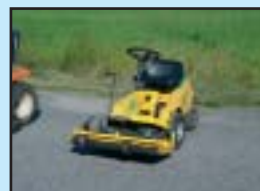
Stiga Villa -90 Klippdäck 85 cm.