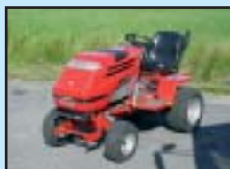
Klippto Trac Diesel, Klippdäck, Snöblad, Sandspridare.