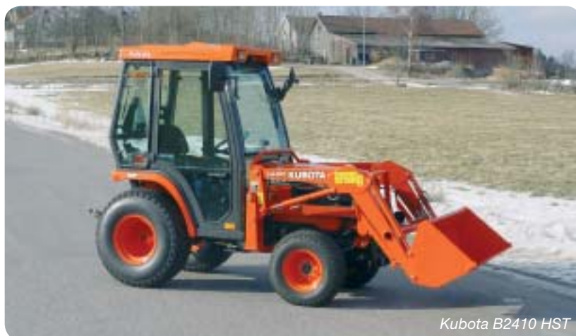
Kubota B2410 HST

Kubota BX2200 är en ny dimension av allt detta i kompakt format. Hög komfort tack vare bekväm körstälning och plant golv. Råstark E-TVCS diesel på 22 hk, 2-växl. hydrostat, diffspärr och servostyrning. Den ombonade hytten och de otaliga redskapsmöjligheterna gör nya Kubota BX2200 till en effektiv och lättkörd traktor med hög nyttjandegrad.