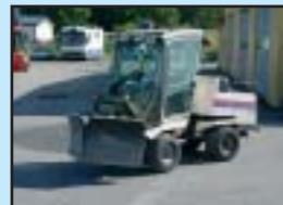
Belos 1500 4WD -89 Klippdäck, Sandspridare, Vikplog.