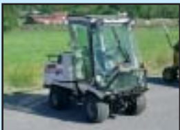
Belos 1500 4WD -89 Klippdäck, Sandspridare, Snöblad.