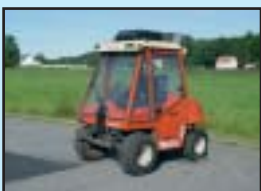
Bucher Multi-48 årsmodell-97 Snöblad, Borste, Klippare, Sandspridare.