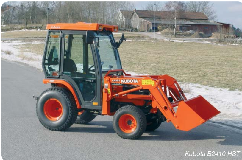
Kubota B2410 HST

Det finns med all säkerhet en Kubota Traktor som passar in i ditt arbete. Här finner du en liten presentation om var och en.